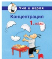
Комплект приложения за ученици за 1-ви клас