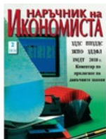
Данъчно законодателство 2010 г. Коментар по прилагане на данъчните закони.