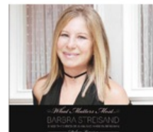
Barbra Streisand- "What Matters Most" (2CD) deluxe edition