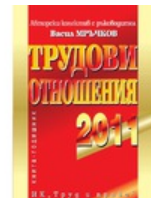
Трудови отношения - 2011 г