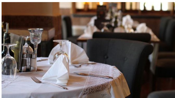
Ресторант "Diwine", Варна

Последна промяна в 19:41 на 31 авг 2011, 110 прочитания, 0 коментара