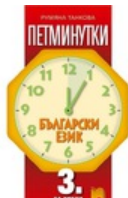
Комплект приложения за ученици за 3-ти клас